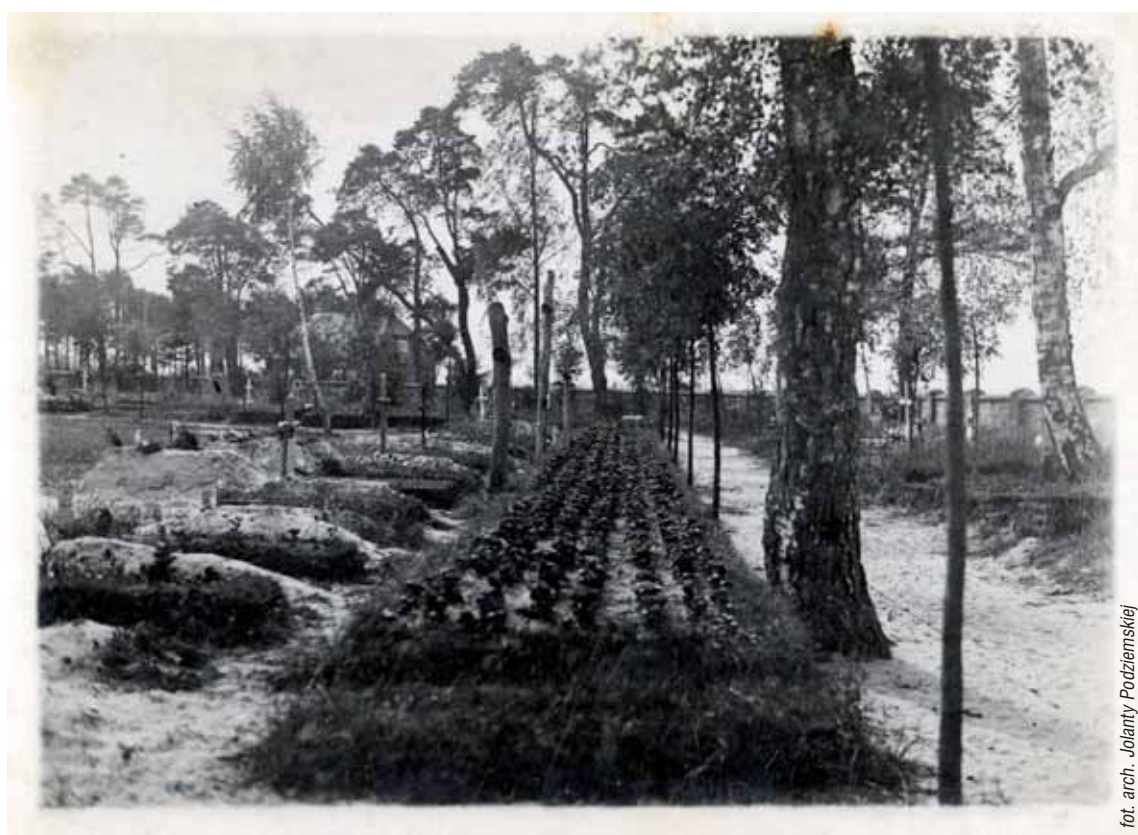
Zbiorowa mogiła na cmentarzu parafialnym w Kole, połowa lat 40.

2 września 1939 roku w Kole zbombardowany został przez Niemców polski pociąg ewakuacyjny.