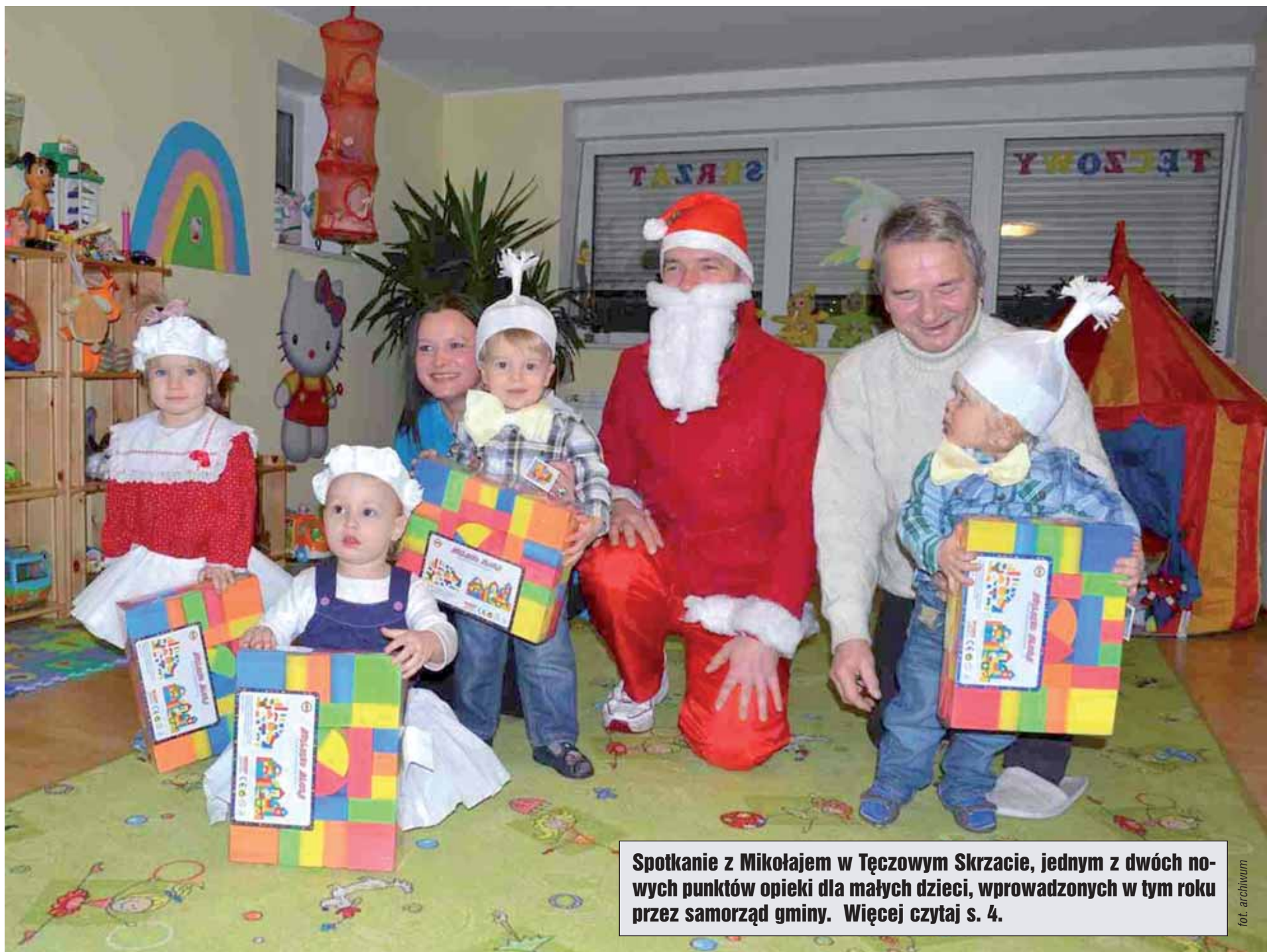
Spotkanie z Mikołajem w Tęczowym Skrzacie, jednym z dwóch nowych punktów opieki dla małych dzieci, wprowadzonych w tym roku przez samorząd gminy. Więcej czytaj s. 4.